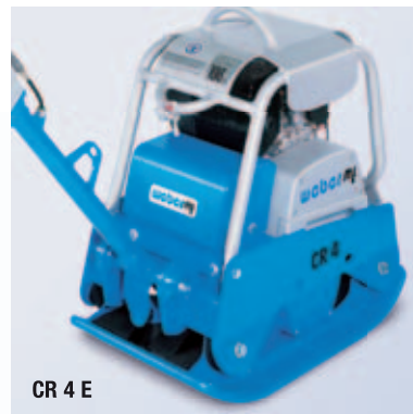
CR 4 E