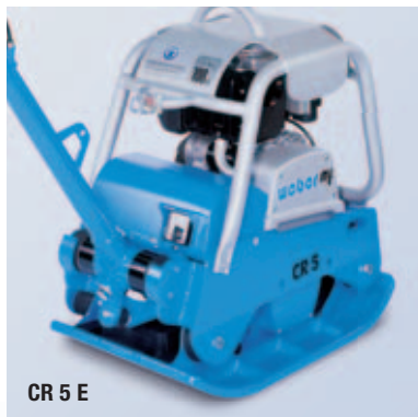
CR 5 E