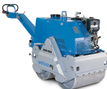
DVH 655 E