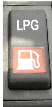
Neutral (4) Mittelstellung (beide Systeme geschlossen)