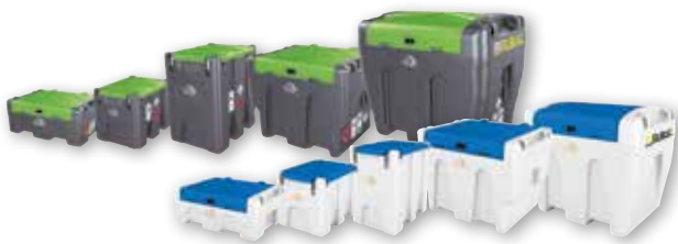
Kunststoff-Behälter von 60 - 9'000 l