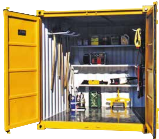
Lager- und Materialcontainer (von 2 - 12 m 3 )