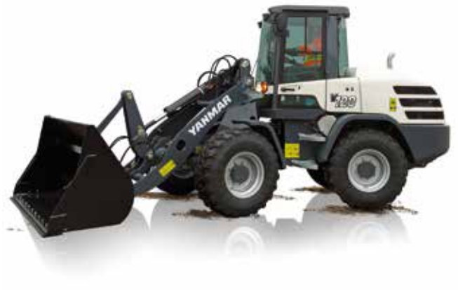
Radlader (3.9 - 7.5 t)