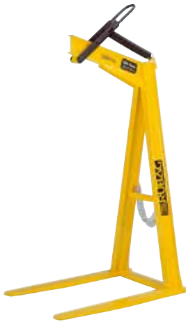
Palettgabeln (Tragkraft 1800 - 3000 kg)