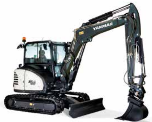
Midi- und Kurzheckbagger (5 - 12 t)