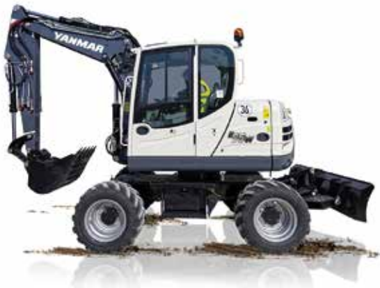
Mobilbagger (7 - 13 t)