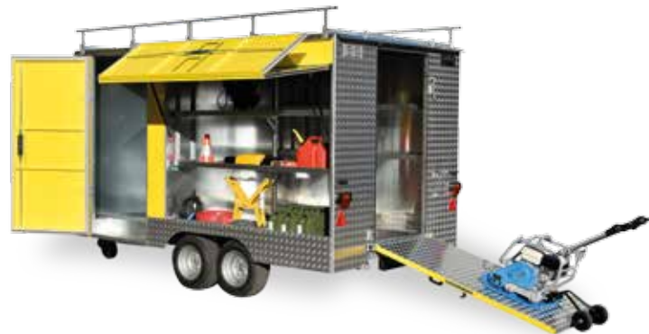
1- und 2-Achs-Geräteanhänger (bis 3.5 t GG)