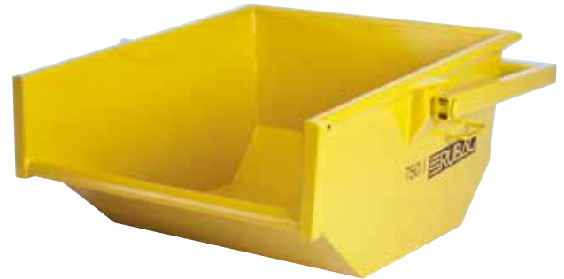
Aushubkübel (Volumen 350 - 3000 l)