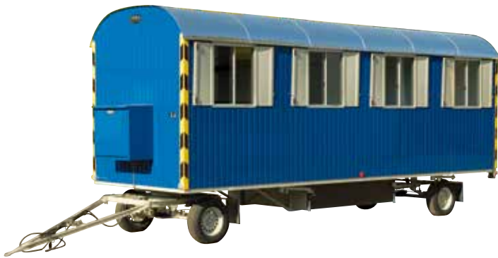
2-Achs Baustellenwagen (6 - 8 m)