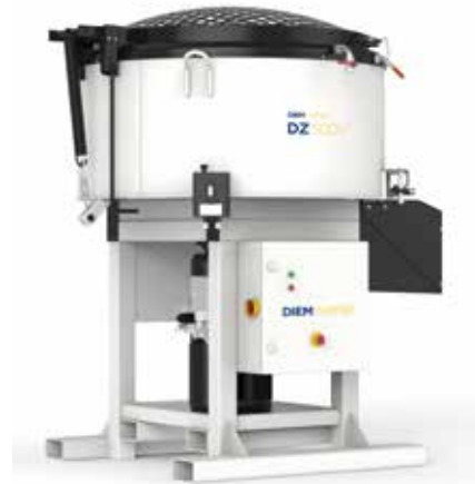
RUBAG Zwangsmischer (Volumen 100 - 1050 l)