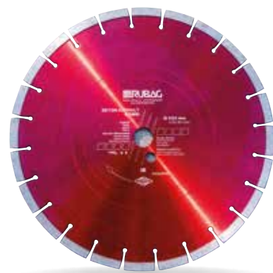
Diamantscheiben (Ø 50 - 1600 mm)