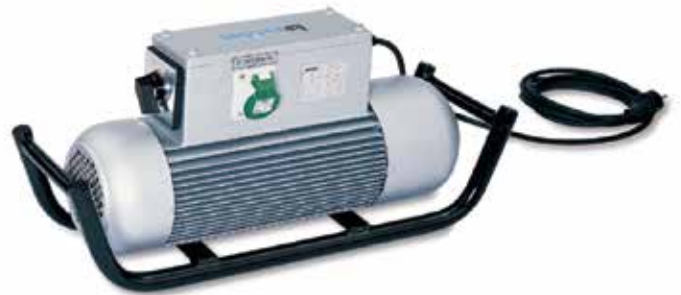
webermät Elektrische Umformer (2.7 - 4.0 kVA)