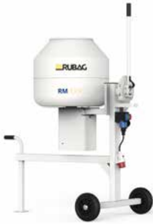
RUBAG Betonmischer (Volumen 100 - 150 l)