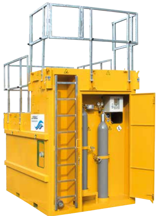
Kombi-Waschbecken und Kombi-Absetzbecken (3.5 - 10 m 3 )