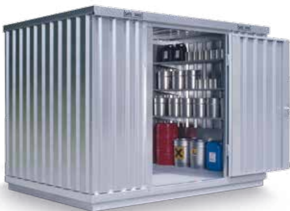
Umweltschutzdepot (Volumen 2 - 60 m 3 )