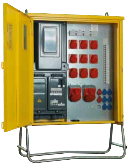
RUBAG Baustromverteiler (nach Kundenwunsch)