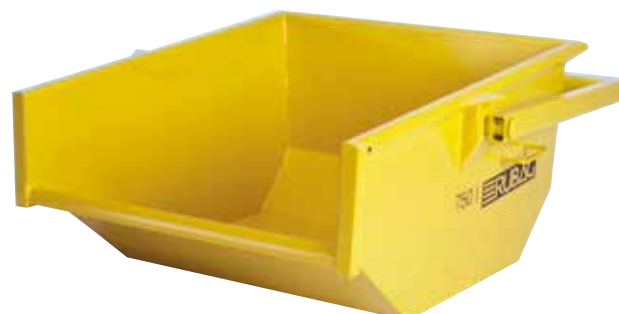
Bennes à terre (volume 350 à 3000 l)