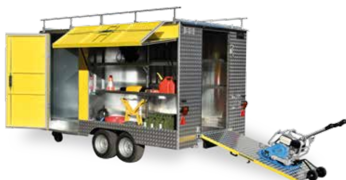
Remorques à outillages avec 1 ou 2 essieux (à 3.5 t PTC)