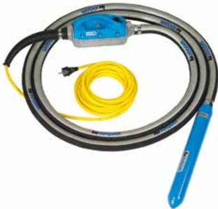
webermî Aiguilles vibrantes (Ø 40 à 58 mm)