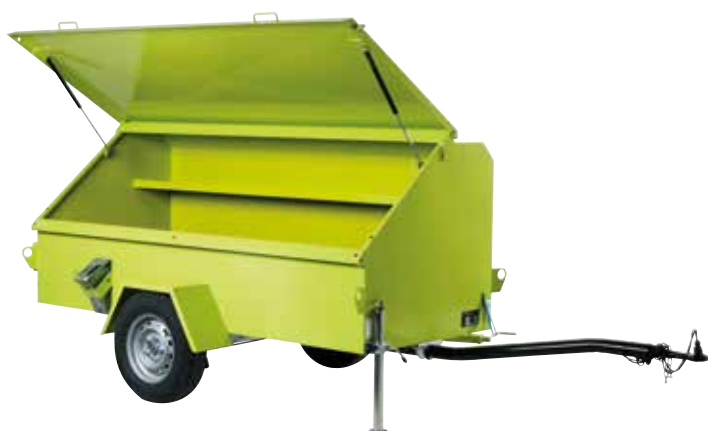
Remorques à outils