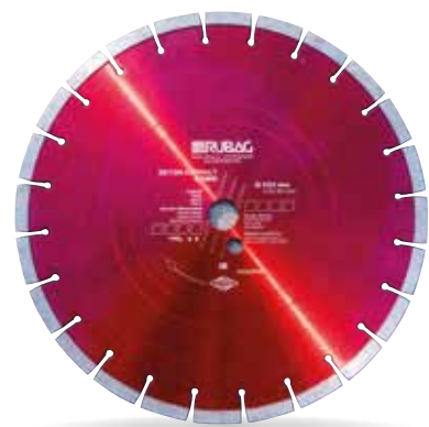
Disques diamantés ( \varnothing 50 à 1600 mm)