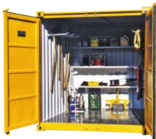
Containers de stockage et à matériel (2 à 12 m 3 )