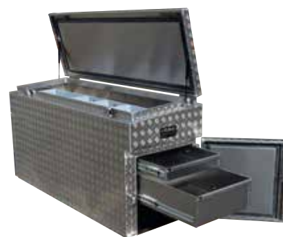
Caisses à outillages