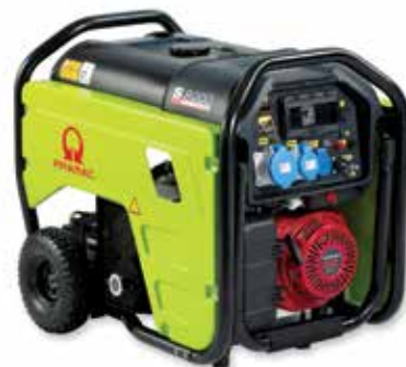
PRAMAC Générateurs (puissance 1 à 3500 kW)