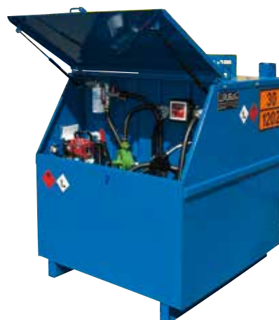
Citernes CH (400 à 20'000 l)