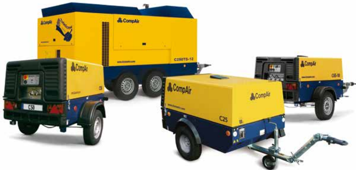
Compresseurs (puissance 2 à 27 m 3 /min., pression de service jusqu'à 24 bar)