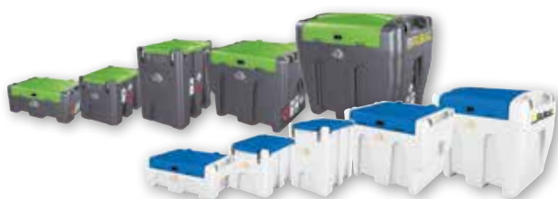
Réservoirs en polyéthylène de 60 à 9'000 l