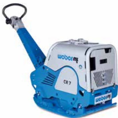
Plaques vibrantes réversibles (100 à 750 kg)