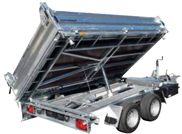
Remorques basculantes (jusqu'à 34 t PTC)