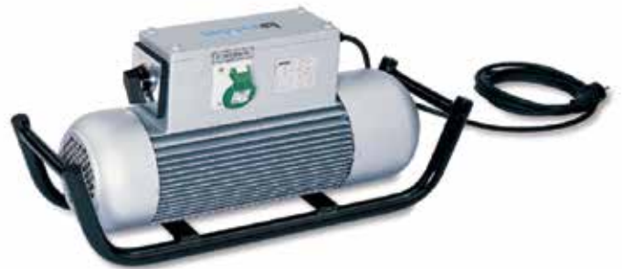
webermî Convertisseurs électriques (2.7 à 4.0 kVA)