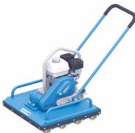
Compacteurs à rouleaux (largeur 420 à 670 mm)