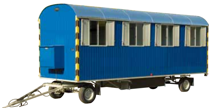
Roulottes à 2 essieux (6 à 8 m)