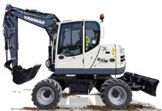
Pelles mobiles (7 à 13 t)