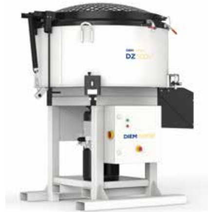
RUBAG Turbo-malaxeurs (volume 100 à 1050 l)