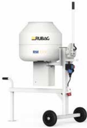
RUBAG Bétonnières (volume 100 à 150 l)