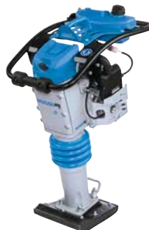
Pilonneuses (55 à 80 kg)