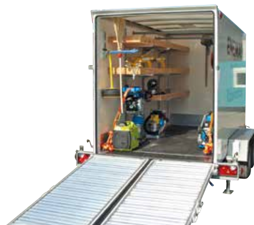
Remorques à outillages combi