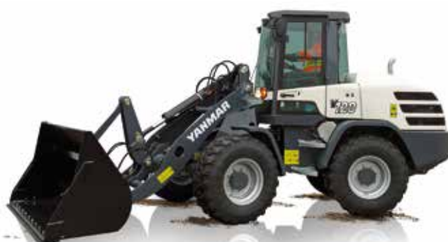
Chargeuses (3.9 à 7.5 t)