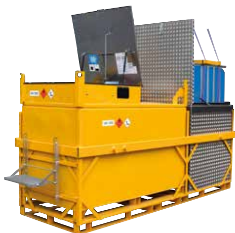
Variante combinée (Diesel et AdBlue®)