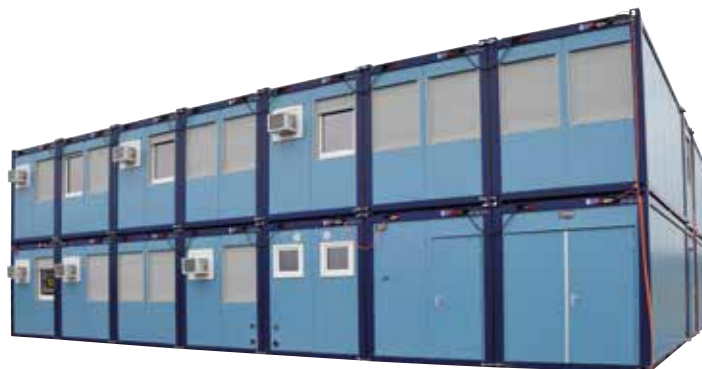
Ensemble de containers