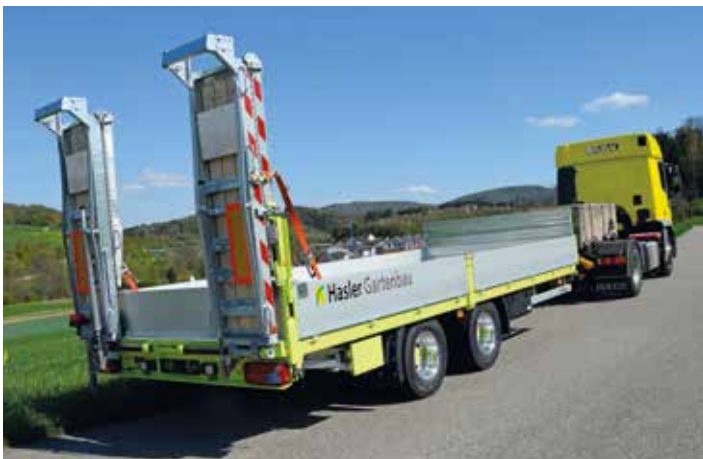
Remorques pour camion (à partir de 3.5 t)