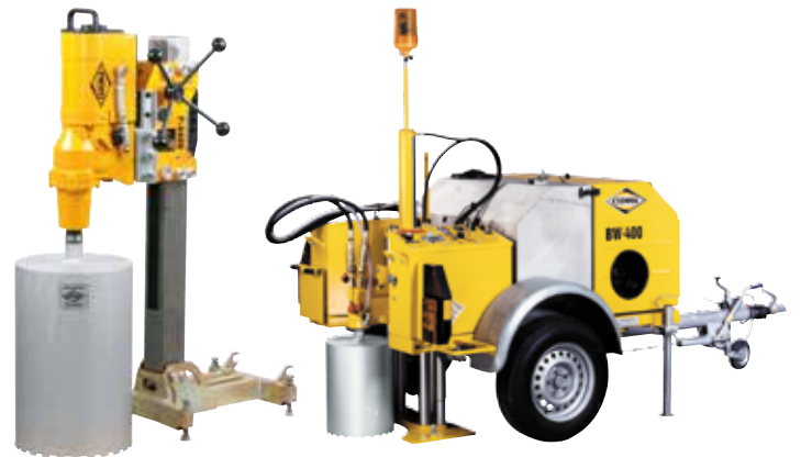
Machines et outils de forage ( \varnothing de forage maximum 20 à 1200 mm)