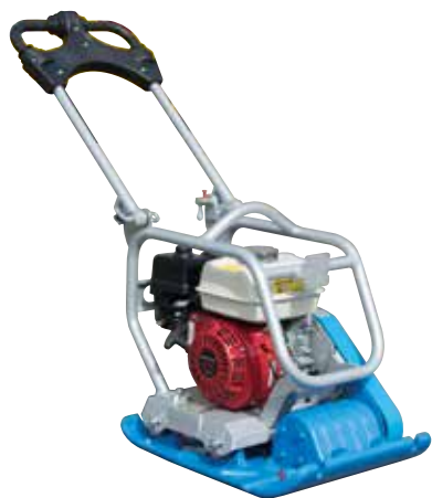
Plaques vibrantes uni-directionnelles (60 à 130 kg)