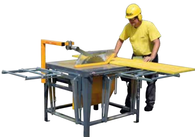
Scies circulaires à table