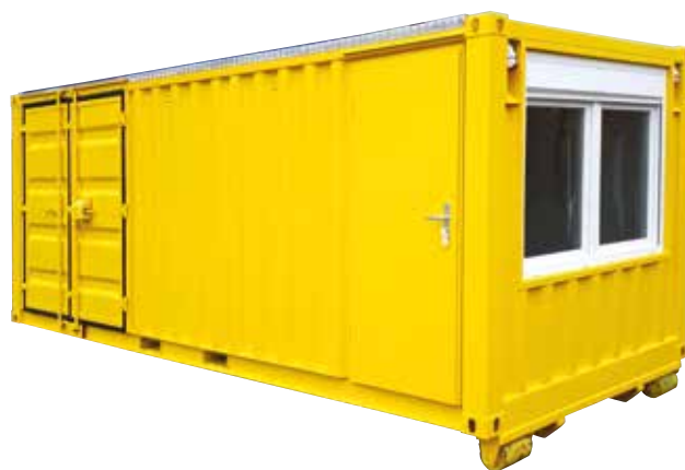
Berces porte container (20 pieds)