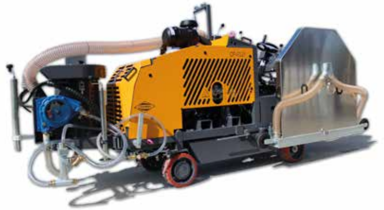
Scies à sol (profondeur de coupe 0 à 480 mm)