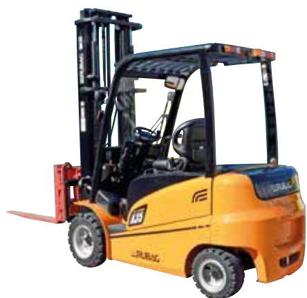
Chariots élévateurs avec moteur électrique ou thermique (portée 1.5 à 10 t)