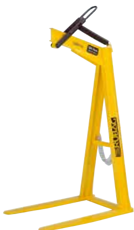
Fourches (portée 1800 à 3000 kg)