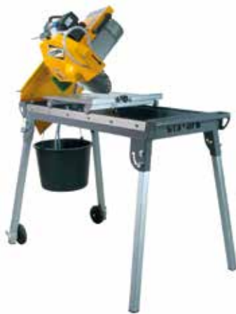
Scies à pierre (profondeur de coupe 0 à 480 mm)