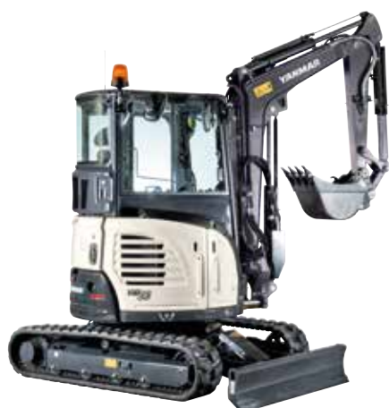
Mini-pelles et arrière court (1 à 5 t)