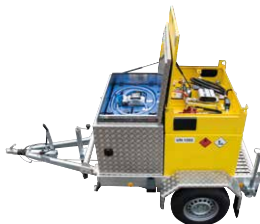
Remorque à citerne