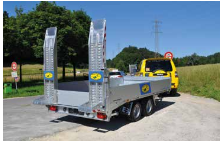
Remorques de transport (poids total jusqu'à 3.5 t)