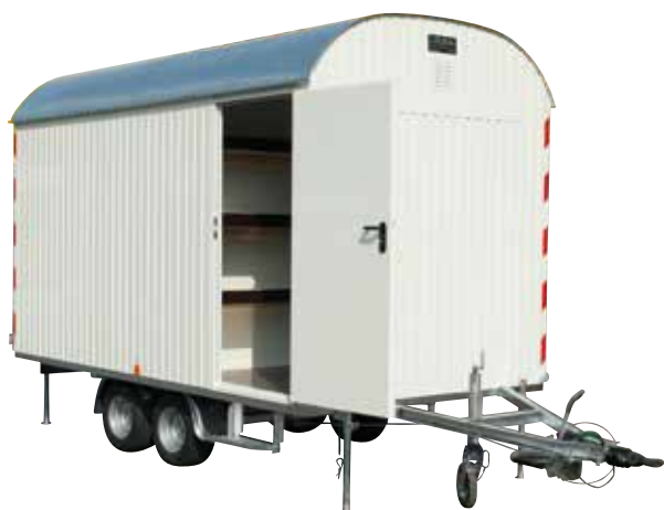
Roulottes à 1 essieu ou tandem (3 à 5 m)