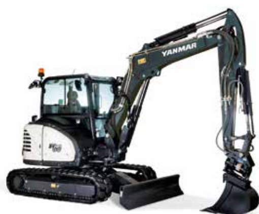
Midi-pelles et arrière court (5 à 12 t)