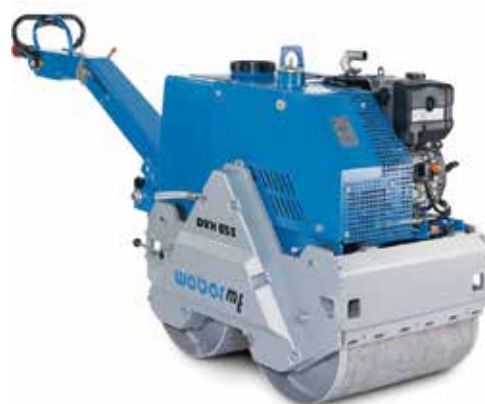
Rouleaux tandem (330 à 750 kg)