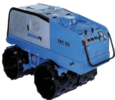
Rouleaux de tranchées (1400 kg)