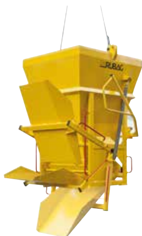
Bennes à béton (volume 250 à 2000 l)