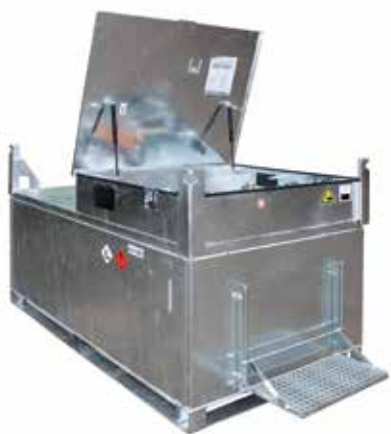
Citernes mobiles IBC (100 à 3000 l)