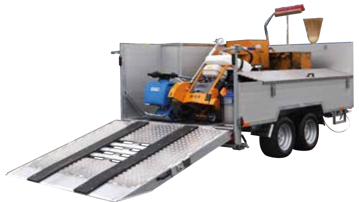
Remorques spéciales avec configuration individuelle selon désir du client