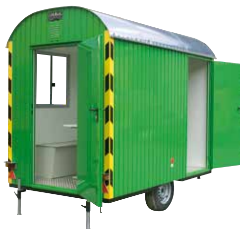
Roulottes de magasinage (2.5 à 3.5 m)